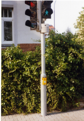
Bild 8: Anforderungseinrichtung und Lautsprecher für Blindensignale