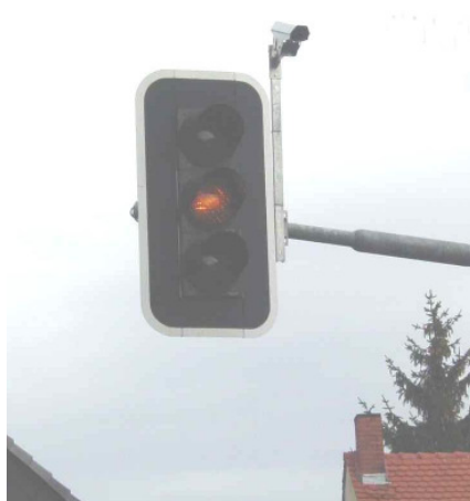
Bild 11: Videokamera am Signalmast zur Kfz-Erfassung

Angedacht ist auch eine Untersuchung verschiedener Systeme zur Erfassung der Verkehrsteilnehmer (Induktionsschleife, Infrarot, Videodetektion, Taster). Ziel ist die Beurteilung der Einsatzfelder und Wirtschaftlichkeit. Die Projektgruppe setzt vermehrt Videokameras (Bild 11) ein, weil sie kostengünstig mehrere Erfassungsstellen ermöglichen.